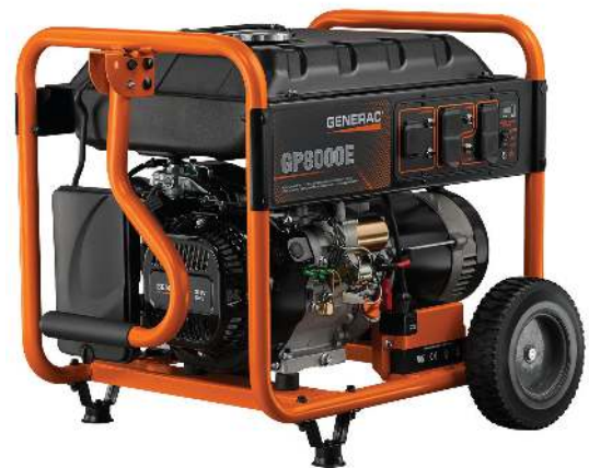
La fotografía puede no representar el contenido real.

Modelo 6954-0 UPC: 696471069549 (49 estados/CSA)